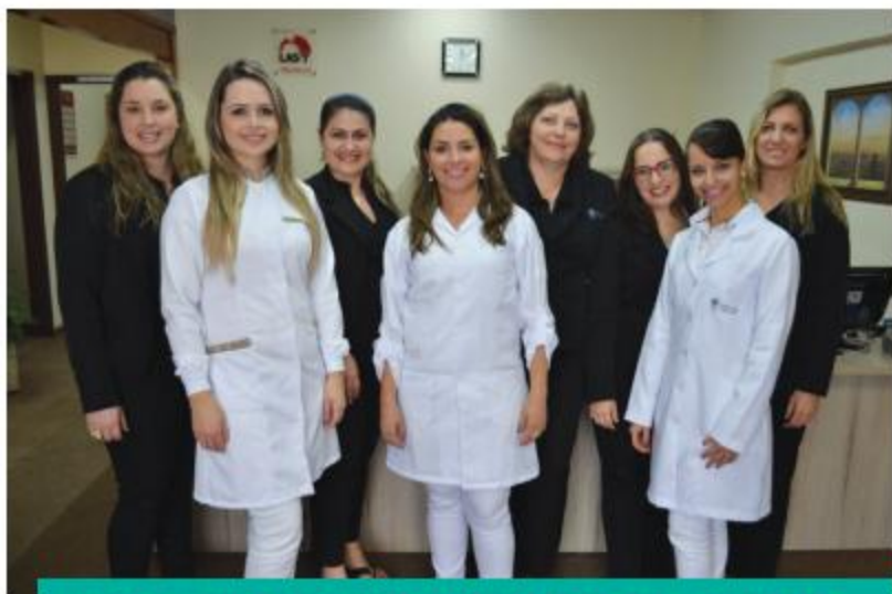
EQUIPE DE EMPREGADAS DA SEDE DE JOINVILLE