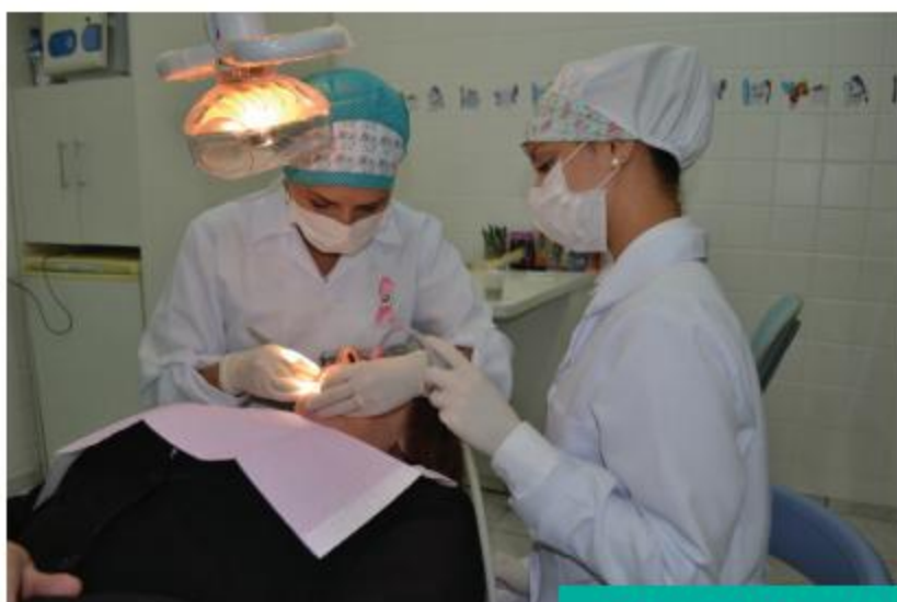
SERVIÇOS ODONTOLÓGICOS REALIZADOS NA SEDE