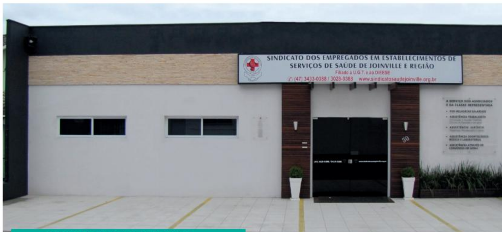
FACHADA DA SEDE DO SINDICATO