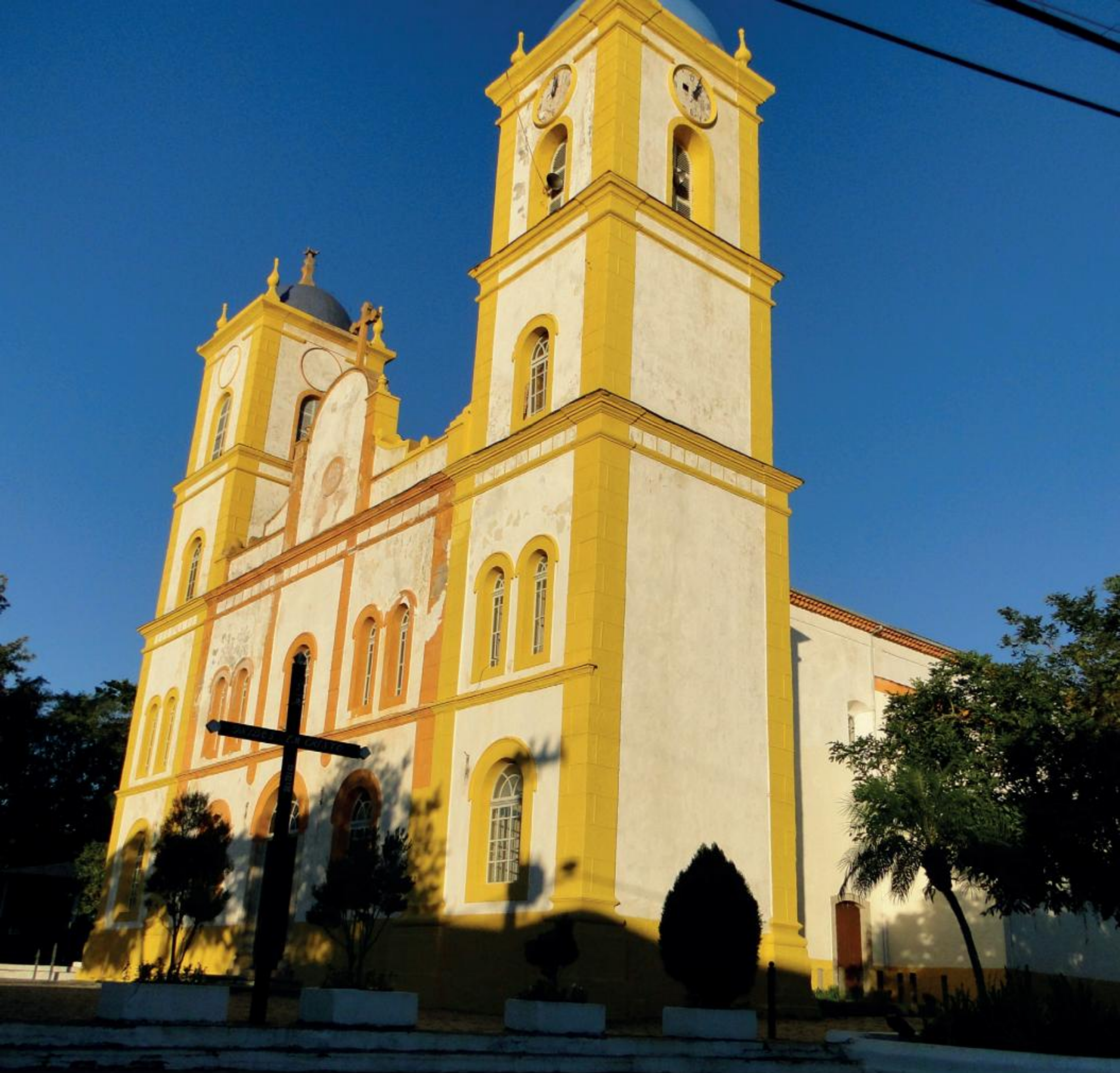
IGREJA NOSSA SENHORA DA GRAÇA