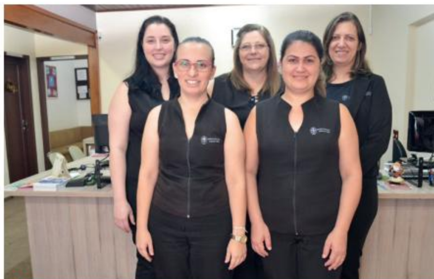
EQUIPE DE EMPREGADAS DA SEDE DE JOINVILLE