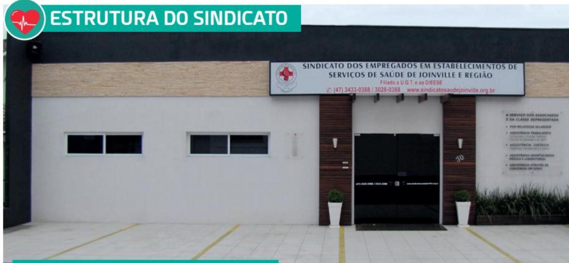
FACHADA DA SEDE DO SINDICATO