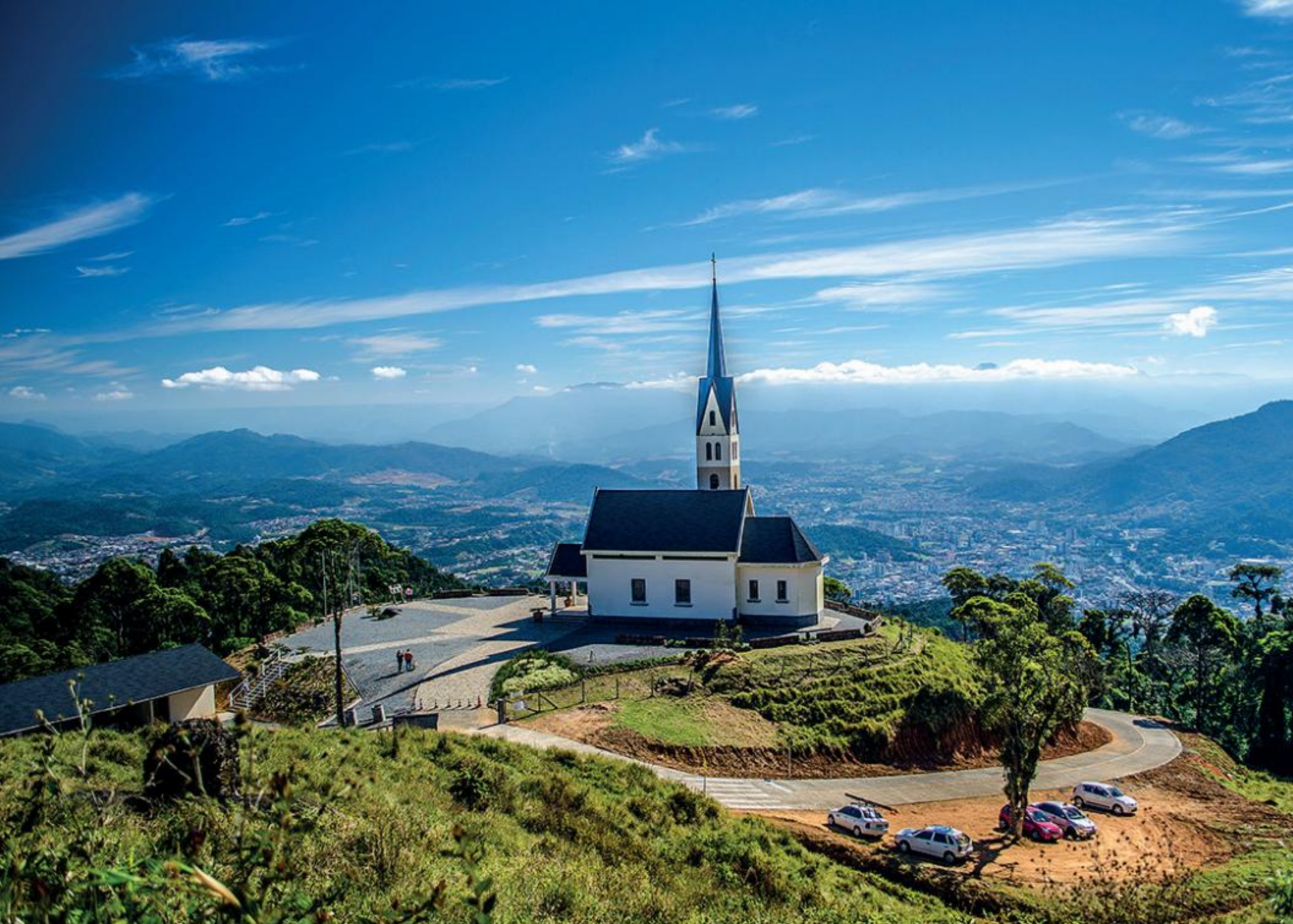
CHIESETTA ALPINA